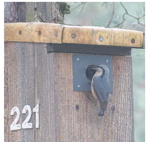
Kowalik przy budce