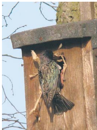
Szpak z materiałem na gniazdo

Członkowie i wolontariusze różnych organizacji prowadzą spacer przyrodnicze i wycieczki. Można wziąć udział w takim wydarzeniu. Stowarzyszenie „Jestem na pTAK” od kilku lat organizuje „Noc sów”. Wyświetlane są filmy o sowach, opowiedane różne ciekawostki z życia sów. Jest wyjście w teren, by tych sów posłuchać.