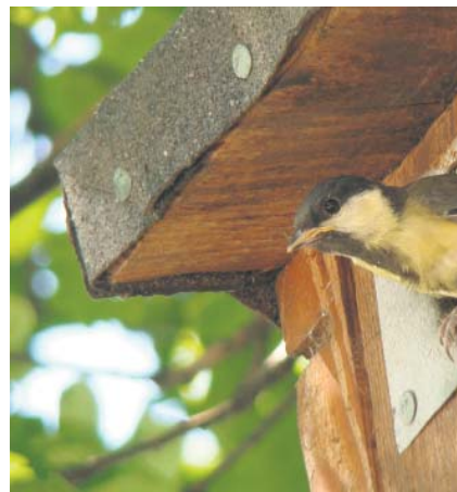
Młoda bogatka tuż przed wylotem