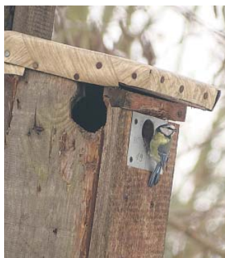
Modraszka przy uszkodzonej budce