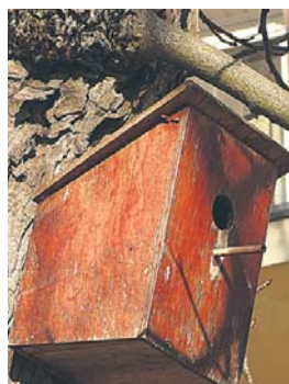
Takich budek nie robimy: z patyczkiem, ze sklejk, za płytka, z daszkiem do góry.