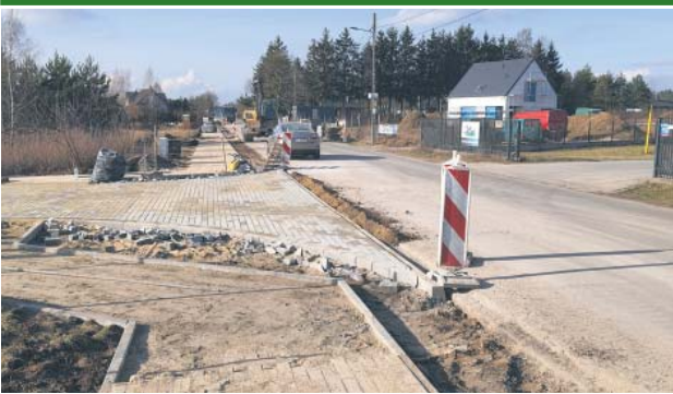
Chodnik ul. Kościelna w Skrzeszewie

Umowę o wartości 7 940 000,03 złotych realizuje firma Drogi i Mosty – Jan Kaczmarczyk z siedzibą w Kacicach. Zadanie podzielone jest na kilka etapów. Aktualnie prowadzone są prace w zakresie budowy chodnika o długości 579 m wzdłuż ul. Kościelnej w Skrzeszewie. Następnie prace przeniosą się do Michałowa-Reginowa, Łajsk, Wieliszewa, Olszewnicy Starej, Poddębna i Krubina.