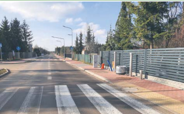
Przepompownia ul. Polna w Wieliszewie

W toku jest realizacja budowy kanalizacji sanitarnej w ul. Polnej, ul. Miłej, ul. Pogodnej, ul. Deszczowej, ul. Daliowej i ul. Złotej w Wieliszewie. Budowa samej sieci kanalizacyjnej została zakończona w grudniu 2023 r. Obecnie trwają prace uzbrajania przepompowni w ul. Polnej.