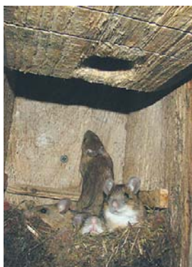
Myszarki leśne w budce typu „A”