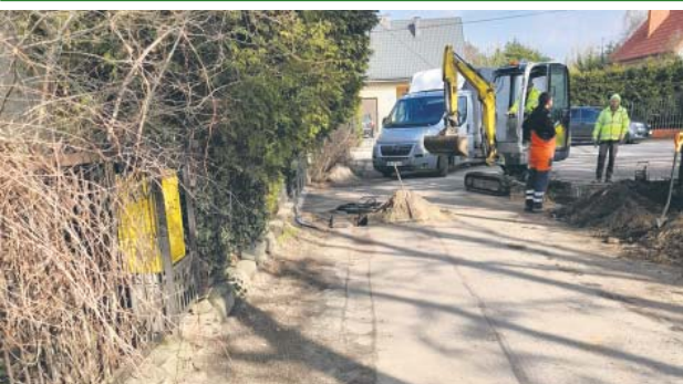
Oświetlenie ul. Słoneczna w Łajskach

Dzięki dofinansowaniu z programu Polski Ład rozpoczęliśmy II etap budowy oświetlenia. Prace realizuje ZestiFos. Na ul. Magnackiej i ul. Wesołej w Wieliszewie oraz ul. Brzozowej w Łajskach ułożono kabel i wykonano fundamenty. Firma rozpoczęła prace na ul. Słonecznej w Łajskach, gdzie zaplanowane jest analogicznych prac.