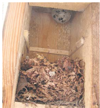
Gniazda gryzonia i os w budce typu „A”