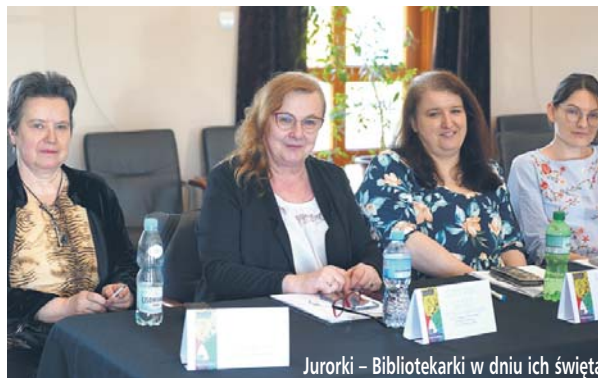
Jurorki – Bibliotekarki w dniu ich święta