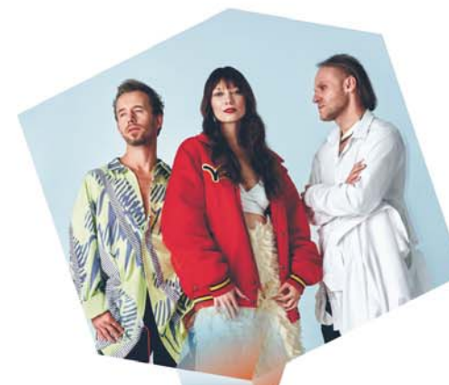
SORRY BOYS 19.20