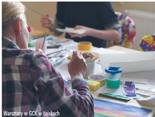
Warsztaty w GCK w Łąskach