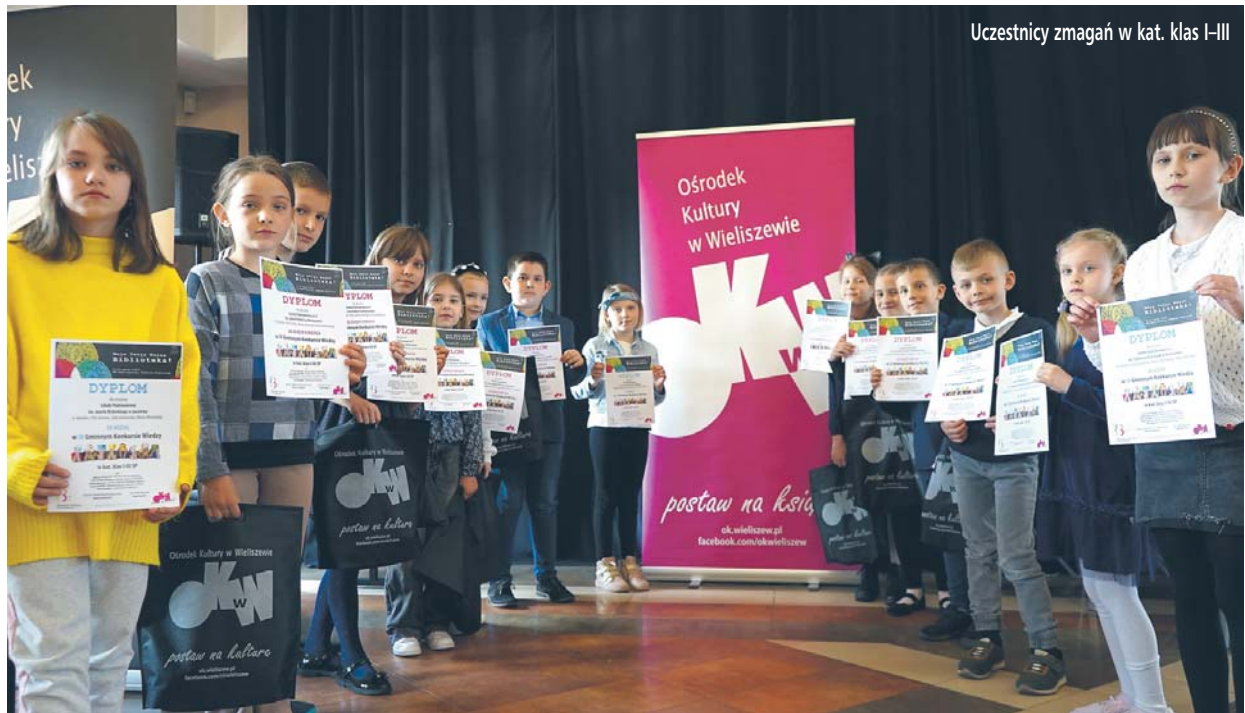
Uczestnicy zmagania w kat. klas I-III