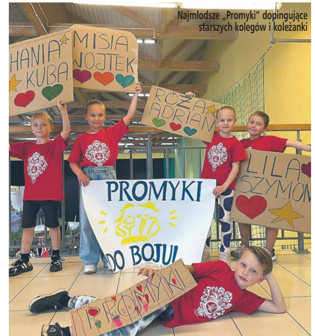
Najmłodsze „Promyki” dopingujące starszych kolegów i koleżanki

Ponad 100 par z 24 ośrodków tanecznych z całej Polski rywalizowało o królewską „szablę i broszę” podczas jubileuszowego 20. Królewskiego Turnieju Tańców Polskich. Zespół Promyki reprezentowało 11 par i aż 7 z nich dotarło do rywalizacji finałowej.