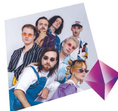
ARS LATRANS ORCHESTRA 17.50