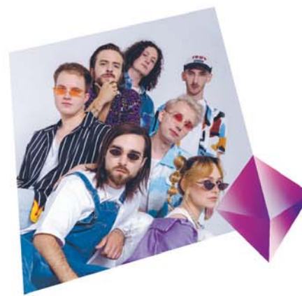
ARS LATRANS ORCHESTRA