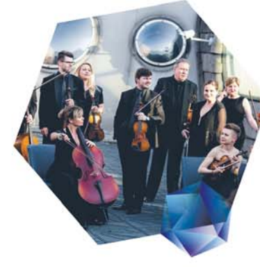
SINFONIA 20.00 VIVA