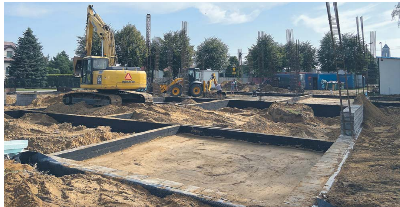
Trwają intensywne prace przy budowie Centrum Społeczno-Kulturalnego w Wieliszewie.

Dokładnie miesiąc temu przy ulicy Niepodległości pojawił się ciężki sprzęt, by kawałek po kawałku, usunąć kolejne elementy starej remizy OSP. Tak rozpoczął się nowy rozdział w życiu wieliszewskiej społeczności. Inwestycja zakończy się za niecałe dwa lata. Wówczas, na działce przy ul. Niepodległości 1, powstanie Centrum Społeczno-Kulturalne, które stanie się miejscem integracji mieszkańców.