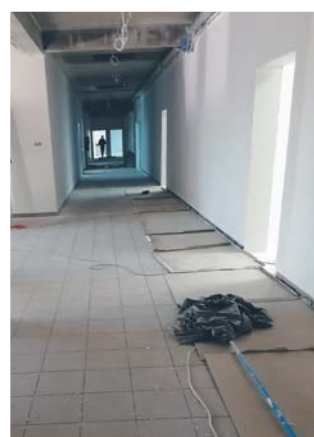
Prace wykończeniowe w szkole podstawowej w Janówku Pierwszym

W styczniu również rozpoczęły się prace wykończeniowe na pierwszym piętrze nowego skrzydła szkoły podstawowej w Janówku Pierwszym. Umowna wartość prac wynosi 750 tys. zł brutto i ich zakończenie planowane jest na początek kwietnia br.