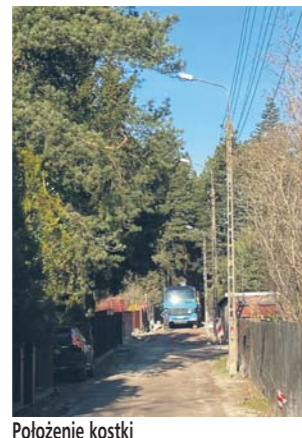
Polozenie kostki ul. Ogrodowa w Michalowie Reginowie