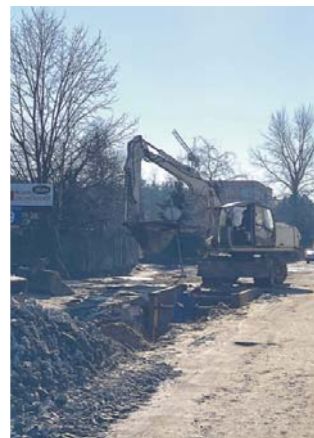
Budowa kanalizacji sanitarnej

W związku z budową ul. Polnej w Wieliszewie na odcinku od ulicy Kościelnej do ul. Miłej wprowadzono czasową organizację ruchu – zakaz wjazdu w ulicę Polną za wyjątkiem pojazdów budowy i dojazdów do posesji (mapka u dołu z prawej strony).