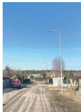
Odbiór oświetlenia na ulicach Łajsk