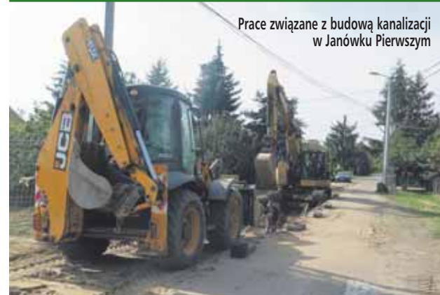
Prace związane z budową kanalizacji w Janówku Pierwszym

Pod koniec września wznowiono prace budowy II etapu kanalizacji w ul. Poprzecznej. Koszt inwestycji wynosi 2 mln złotych. Prace wykonuje firma MULTI-KOM Andrzej Nakielski z Ostrołki, a zakończenie planowane jest na 30 listopada br.