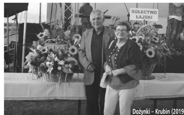
Dożynki – Krubin (2019)