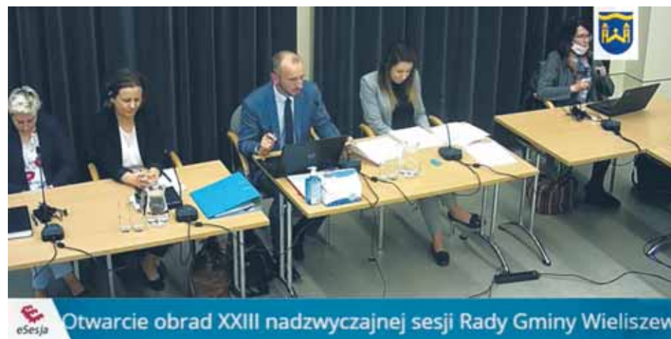
Otwarcie obrad XXIII nadzwyczajnej sesji Rady Gminy Wieliszew

W październiku Radni Gminy Wieliszew spotkali się dwukrotnie, by przedyskutować najistotniejsze dla mieszkańców sprawy.