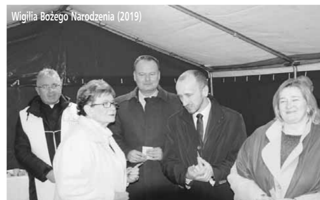
Wigilia Bożego Narodzenia (2019)