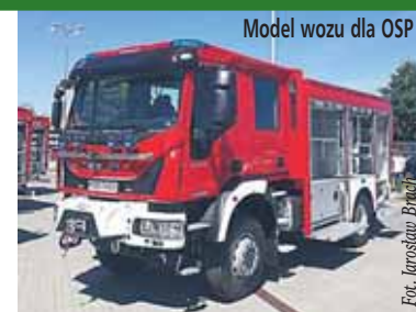
Model wozu dla OSP

Ochotnicza Straż Pożarna Janówek-Góra już niedługo wzbogaci się o średni samochód ratowniczo-gaśniczy. Dzięki temu strażacy będą mogli jeszcze lepiej i sprawniej czuwać nad zdrowiem i życiem mieszkańców. Koszt inwestycji to ok. 680 tys. złotych. Zamówienie wykona firma MOTO-TRUCKS Sp. z o.o. z Kielc.