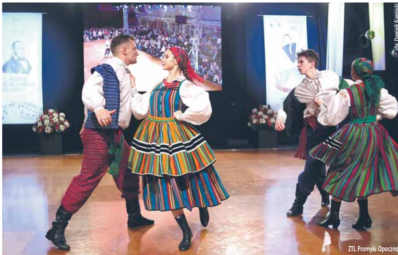
ZTL Promyki Opoczno

XX Festiwal Pieśni i Tańców Polskich im. Stanisława Moniuszki ON-LINE • 10 listopada 2020 r., godz. 19.00, LIVE: www.youtube.com (kanał OK Wieliszew) + www.facebook.com/okwieliszew/ i www.facebook.com/GminaWieliszew/