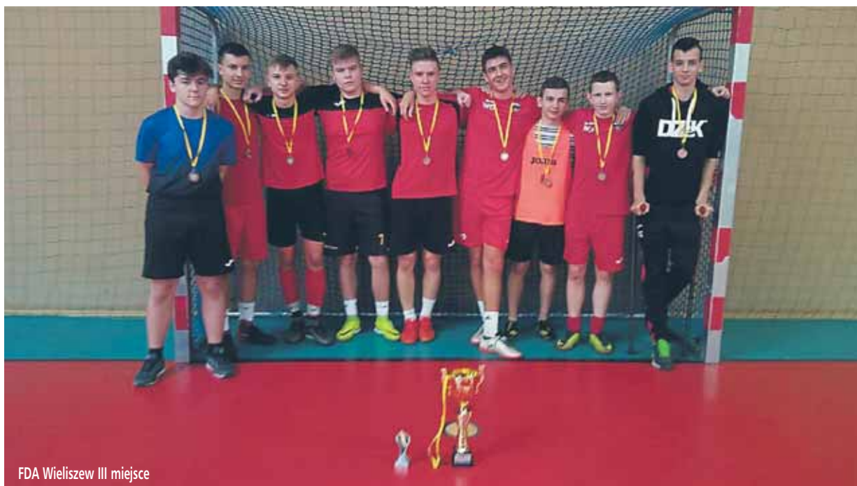
FDA Wieliszew III miejsce