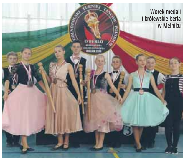
Worek medali i królewskie berła w Melniku