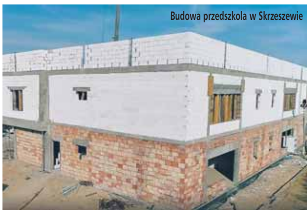
Budowa przedszkola w Skrzeszewie

Kończy się okres czteroletniej kadencji i przyszedł czas na posumowanie tego, co udało się zrealizować w tym okresie.