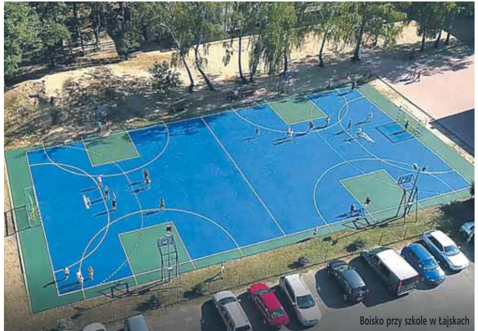
Boisko przy szkole w Łajskach