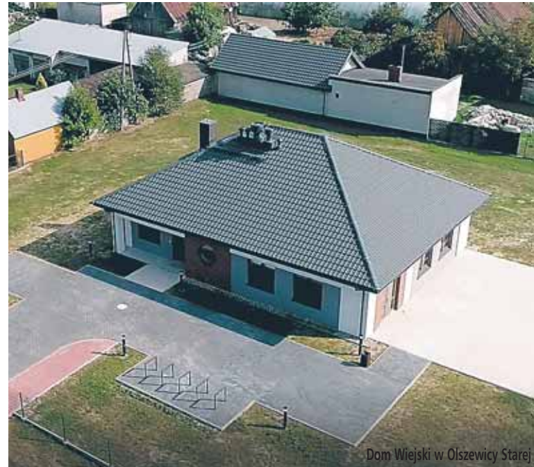
Dom Wiejski w Olszewicy Starej