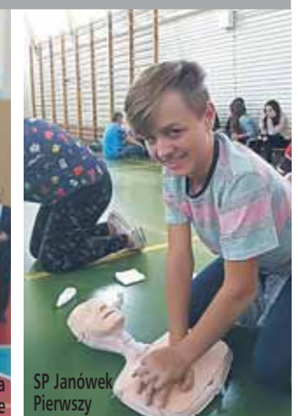
Hala sportowa w Wieliszewie