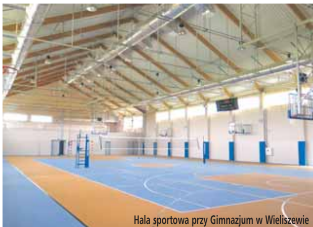
Hala sportowa przy Gimnazjum w Wieliszewie

Gmina Wieliszew jest bezpiecznym oraz przyjaznym miejscem dla pieszych i rowerzystów między innymi dzięki budowie ścieżek rowerowych z chodnikami: między rondami w Poniatowie, na ulicy Przedpełskiego i 600-lecia w Wieliszewie, wzdłuż ulicy Nowodworskiej, która łączy Janówek i Górę z Nowym Dworem Mazowieckim, chodnik w Górze – wzdłuż ulicy Warszawskiej, chodnik przy ulicy Prostej w Olszewnicy Starej, przy ulicy Kościelnej w Skrzeszewie, a na ukończeniu jest ścieżka rowerowa i chodnik wzdłuż ulic Nowodworskiej i Suwalnej w Łajskach. Diametralnie zostało poprawione bezpieczeństwo na skrzyżowaniu ulic Dworcowej i Nowodworskiej w Górze i Janówku Pierwszym, poprzez jego przebudowę oraz instalację sygnalizacji świetlnej.