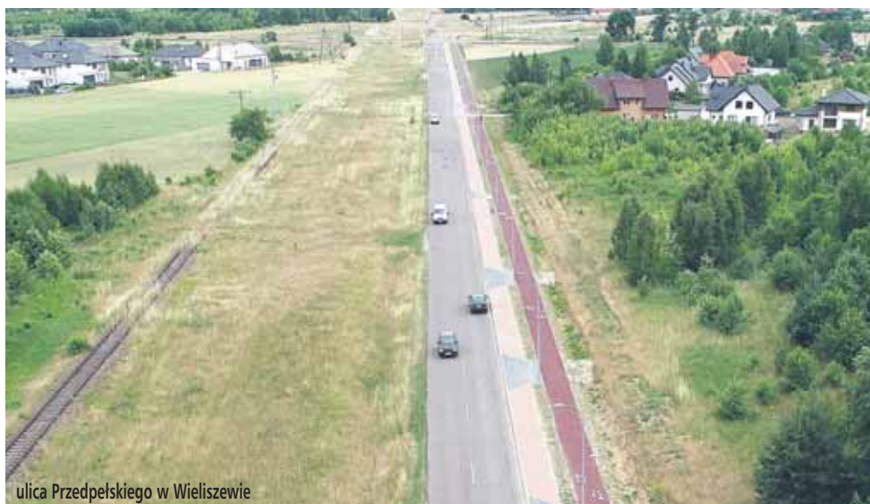
ulica Przedpełskiego w Wieliszewie