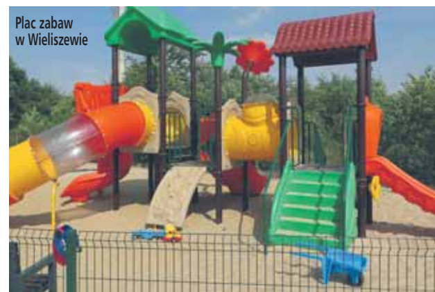
Plac zabaw w Wieliszewie

To jedne z ważniejszych działań, jakie udało się zrealizować przez ostatnie 4 lata. Wiele inwestycji jest jeszcze na etapie realizacji.