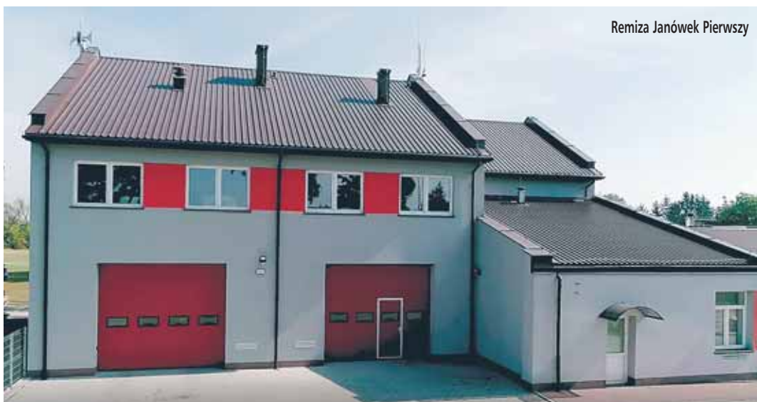
Remiza Janówek Pierwszy