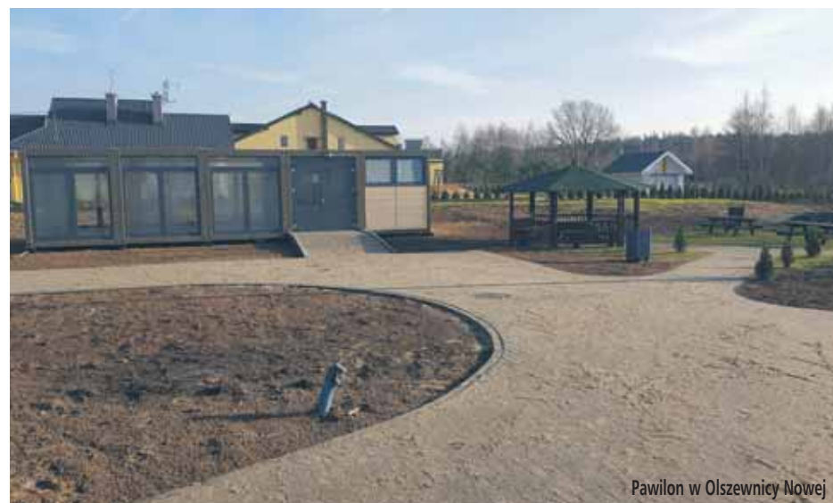
Pawilon w Olszewicy Nowej