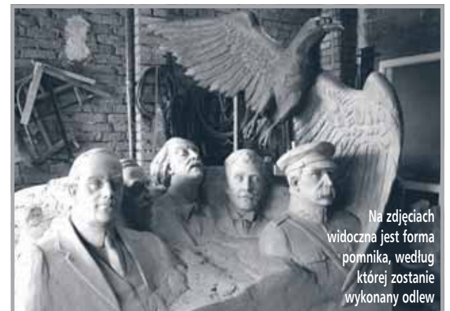
Na zdjęciach widoczna jest forma pomnika, według której zostanie wykonany odlew.

Wojskową oprawę wrześniowych uroczystości w postaci posterunków honorowych, kompanii honorowej z poczem flagowym i poczem sztandarowym oraz Apelem Pamięci zapewnił tradycyjnie 32. Wieliszewski dywizjon rakietowy Obrony Powietrznej im. gen. dyw. Gustawa Konstantego Orlicz-Dreszera. Dziękujemy!