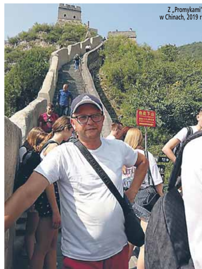
Z „Promykami” w Chinach, 2019 r.