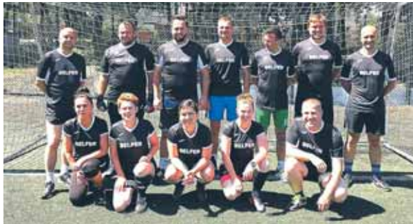
Mazovia Cup 2019 – mistrzostwa Mazowsza w piłce nożnej samorządowców, drużyna nauczycieli i urzędników.