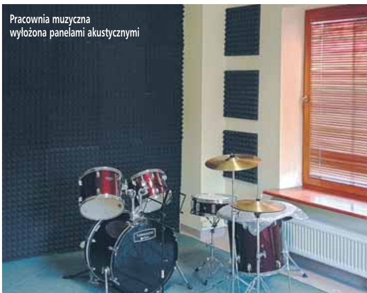
Pracownia muzyczna wyłożona panelami akustycznymi

(Uwaga! W holu GCK może jednorazowo przebywać do 5 osób, obowiązuje zasłanianie ust i nosa oraz wpis na listę gości.)