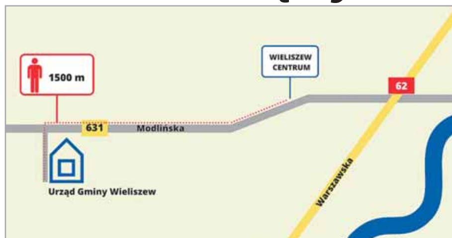
Od przystanku Wieliszew Centrum do Urzędu Gminy Wieliszew będzie można dojść pieszo

Rewitalizacja obejmie blisko czterokilometrowy odcinek linii kolejowej między Wieliszewem a Zegrzem Południowym. Połączenie z Warszawą będą obsługiwały pociągi Szybkiej Kolei Miejskiej. Na trasie mają jeździć składy o długości dochodzącej do 180 m, a ich maksymalna prędkość wyniesie 80 km/h. Zgodnie z założeniami, w ciągu doby do Zegrza i z powrotem ma jeździć 30 pociągów – co pół godziny w szczycie i co godzinę poza nim.