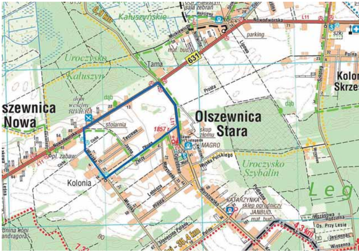
Nowa trasa wydłużonej linii L34

Z początkiem roku informowaliśmy Państwa o podpisaniu nowej umowy na świadczenie publicznego transportu zbiorowego. Do listopada 2021 r. usługi te świadczyć będzie PKS Polonus. W ramach nowej umowy na naszych trasach jeżdżą autobusy hybrydowe, dzięki czemu bardziej dbamy o środowisko.