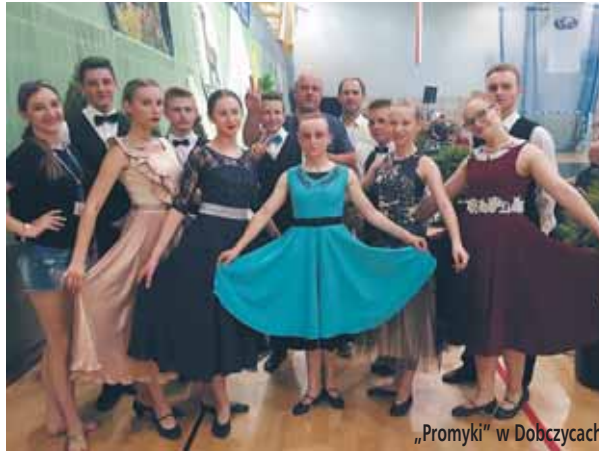
„Promyki” w Dobzczykach

Świat czarów to jeden z najbardziej interesujących dzieci obszarów. W świecie tym lewitacja, przenikanie przez szyby, przemieszczanie się różnych przedmiotów to sprawy jak najbardziej oczywiste. Zaświadczyć o tym mogą wszyscy nasi najmłodsi, którzy na zakończenie spektaklu nagrodzili mistrza rześnymi oklaskami, a na pamiątkę pobytu w zaczarowanym świecie pozowali do wspólnych fotografii. Magiczne sztuczki oczywiście nie powiodłyby się bez udziału asystentki i pomocy młodych widzów, którzy gościli na sce-